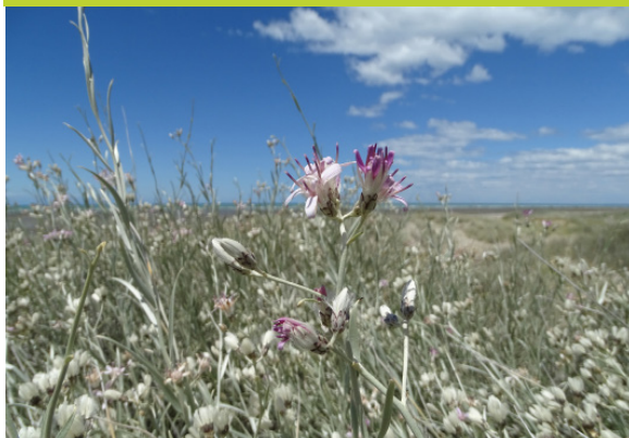
Olivillo ó blanquilla u Oreja de conejo Hyalis argentea - Subarbusto