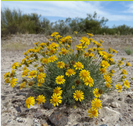
Perilla ó Manzanilla de monte Thymophylla pentachaeta - Hierba