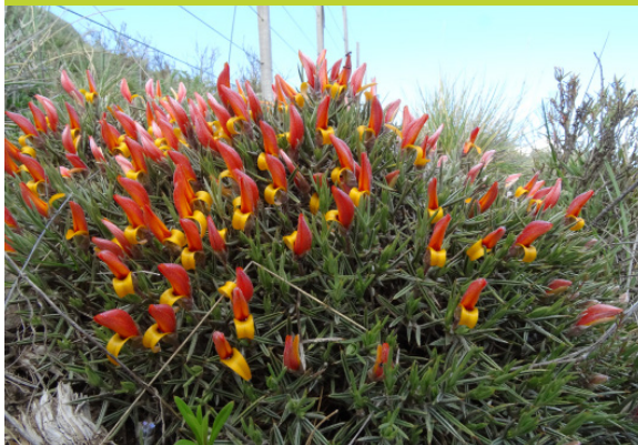
Neneo macho Anarthrophyllum strigulipetalum - Arbusto