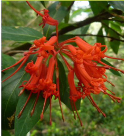
Notro Embothrium coccineum - Arbolito