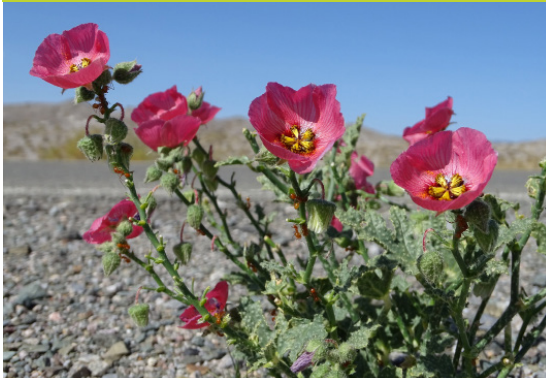
Huella - Lecanophora heterophylla - Hierba