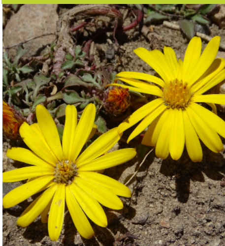
Grindelia: Grindelia prunelloides - Subarbusto