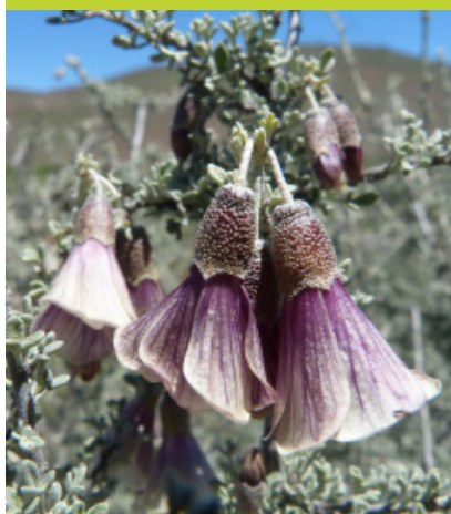
Monte Moro Corynabutilon bicolor - Arbusto