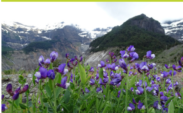
Arvejilla - Lathyrus magellanicus - Enredadera