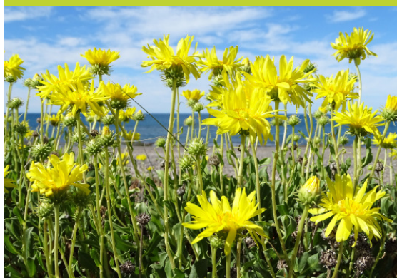
Botón de oro ó Melosa - Grindelia chilensis - Subarbusto