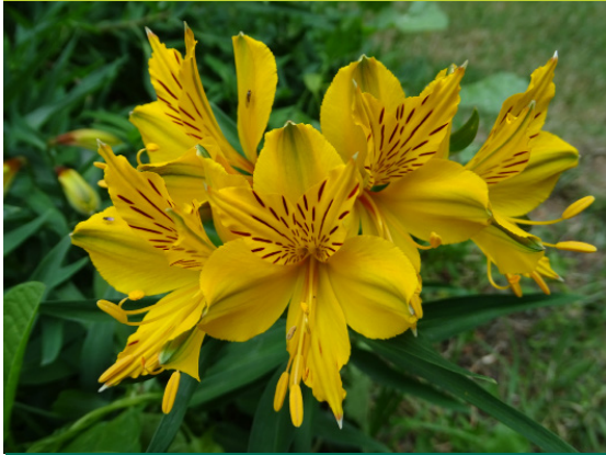
Amancay - Alstroemeria aurea - Hierba