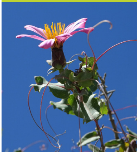
Reina mora Mutisia spinosa - Enredadera